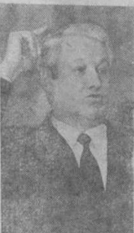
Б. Н. ЕЛЬЦИН — первый Президент России.