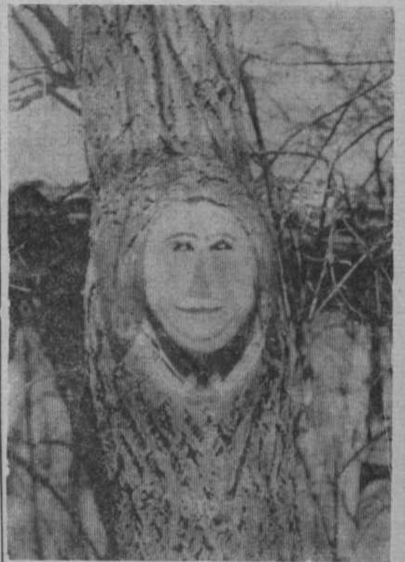
Что бы это значило?