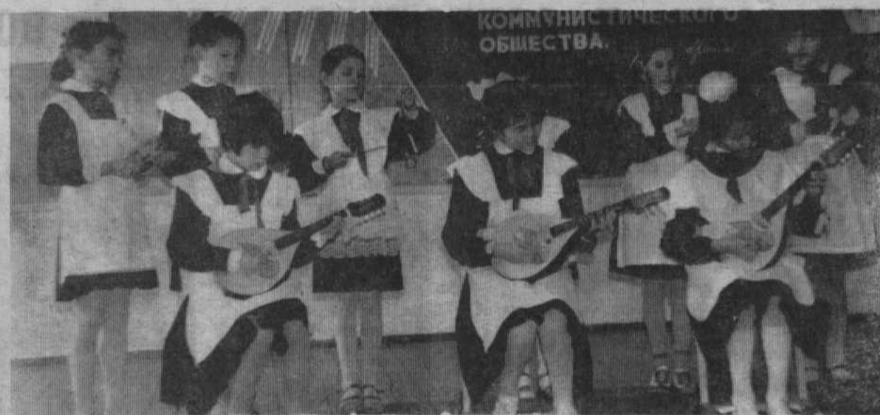
кальном инструменте. Однако ансамбль пока не большой. Но есть надежда, что ребята проявят интерес к игре на мандолине.

Отрадно было бы видеть, если бы больше детей занималось игрой на этом прекрасном музы-