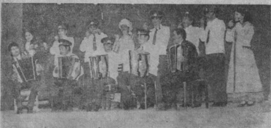
НА СНИМКЕ: Выступают сотрудники РОВД.

Государственный бюджет на 1990 г. по МВД СССР утвержден с ростом против предыдущего года на 13,6 процента и составляет 6,4 млрд. руб. Выделены средства на увеличение еще на 5 тыс. чел. штатной численности следователей.