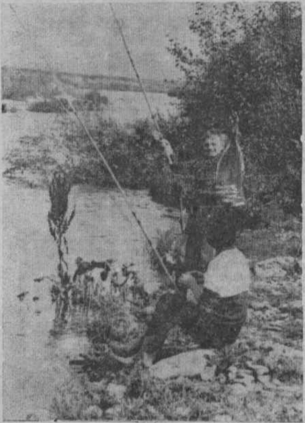
Редактор Ш. М. БАЙГУСКАРОВ.

Правление Хайбуллинского райпо доводит до сведения жителей района о том, что на основании решения исполкома райсовета № 248 от 4 октября 1990 года продажа всех товаров покупателям будет производиться на основании прописки по месту жительства.