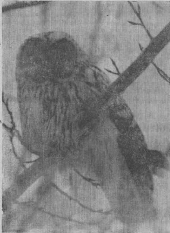
Наш корреспондент летом 1988 года в поиме р. Таналык запечатлел в гнезде птенцов совы. А недавно во двор редакции пожаловал прекрасный представитель пернатых. Может быть старый знакомый? Или поправилось позировать.