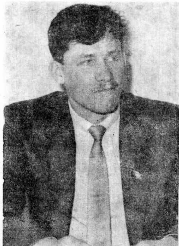
НА СНИМКЕ: Член Верховного Совета СССР А. В. Шаронов.