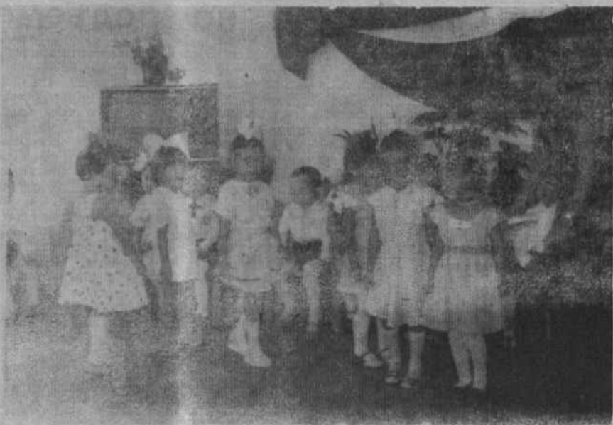
НА СНИМКЕ: «Мы вшучата Ленина, внуки Октября».