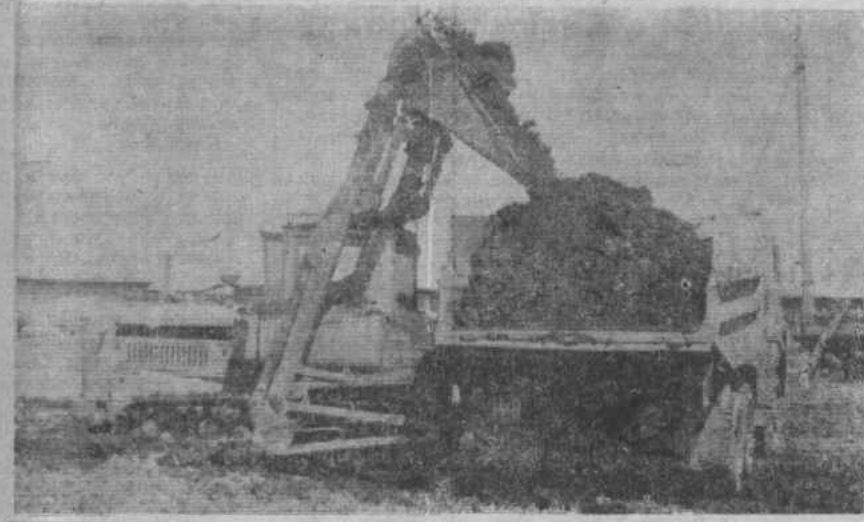
В райкоме КПСС, исполкоме райсовета, райкоме профсоюза и райкоме ВЛКСМ