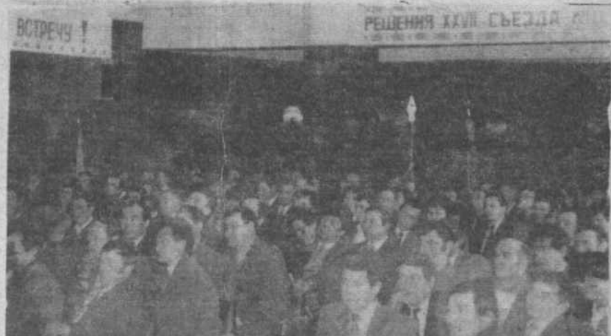
НА СНИМКЕ: участники собрания в зале заседаний.

1988 год должен явиться переломным в годовом перестройки не только в экономике, но и в деятельности всех участников производства, сферы обслуживания и в а н и я, заметного улучшения условий жизни и труда каждого труженика района.