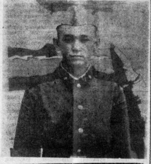
Редактор Б. Г. НАЗАРГУЛОВ.

Хайбуллинской ветлаборатории на постоянную работу требуются: ветврачи (оклад 190—200 рублей), санитарки (оклад 99 рублей), техничка (оклад 80 рублей). Отпуск предоставляется на 24 рабочих дня.