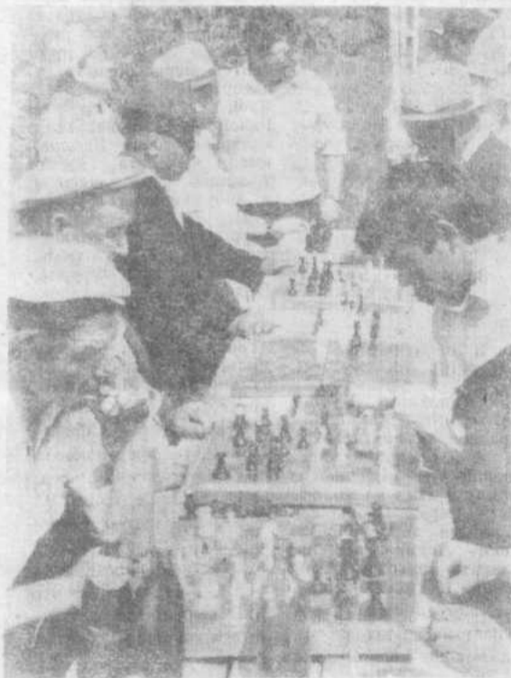
Много поклонников у древней игры в шахматы. Любят посидеть за доской едва разучившие ходы фигур дети и опытные игроки, а также убежденные седые ветераны.

Комитет физкультуры и спорторганизаторы всегда могут без особых затруднений провести турниры как среди сел, так и между соседями. Это интересно и полезно во всех отношениях.