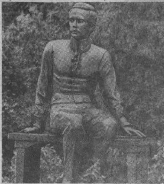
НА СНИМКЕ: памятник М. Ю. Лермонтову в Тарханах (скульптор О. Комов).

Существует целый ряд музеев М. Ю. Лермонтова в Пятигорске (открыт в 1912 г.), Лермонтовский зал в музее Института русской литературы (Пушкинский Дом). В 1917 г. музею был передан материал Лермонтовского музея