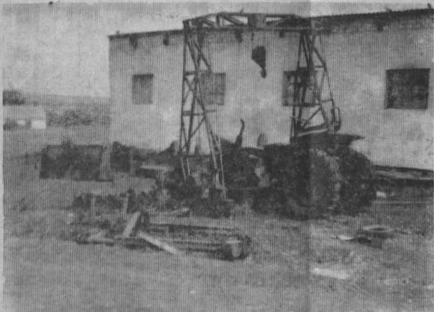
НА СНИМКЕ: Трактор Т-25 в Савельевском отделении.

ние две сеялки кукурузные СУПН-8, три зерноуборочных комбайна, дробилка СКОФ-6, кормоуборочный комбайн КПК-2,4-1. В первой бригаде не установлены на хранение один агрегат зерновых сеялок с остатками ржи в семенных ящиках, комбайн КНР-1,5 и КС-1,8, два подборщика ПК-1,6. Не установлены также на хранение пресс-подборщик ПС-1,6, культиватор-греборыхлитель КПГ-2,2, лущильник ЛДГ-10. Установленные на хранение сеялки в количестве 15 штук не соответствуют требованиям ГОСТа. Катушки не смазаны, цепи не сняты, пружины стоек не разгружены, диски сошников не покрыты антикоррозийным раствором.