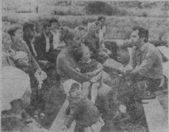
Новгородская область. По инициативе Валдайского райкома КПСС в районном центре и на

центральных усадьбах колхозов и совхозов организованы агитплощадки, где проводятся встречи членов бюро райкома, советских и хозяйственных работников с жителями. Разговор идет о текущих делах и проблемах района.