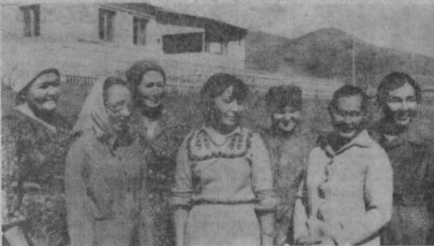
НА СНИМКЕ: коллектив Б-Арслангуловской фермы.