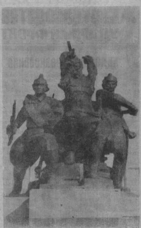
Столица Советской Башкирии г. Уфа богата памятниками, которые олицетворяют нашу историю, годы борьбы и труда. Привлекает внимание памятник бессмертным героям Великого Октября и гражданской войны. В суровом облике солдата революции образно передана решимость бороться до конца, преданность делу трудового народа.