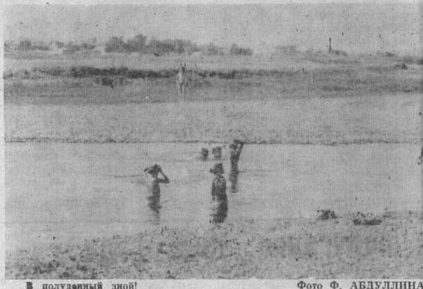
В полуденный зной!

Бросало нас по свету по всему. . . Но стоит нашим детям закружиться, Произлет нас тревога — почему? Ракеты настороженно стоят, Приборами и кнопками застыв, Отцы иль сыновья отцов сидят За пультами на страже тишины. Поставить мир на острие грозят За океаном (есть тайне, знаем!), «И ваши дети мирно спать хотят. . .» Мы говорим им, мы предупреждаем. И дети всей земли — им бы играть! — Твердят отцам, собравшись гурьбой: «Опасности других не подвергай! Учи, мы, папа, ждем тебя домой!» Цех заводской Дыханье затанов, Проходим мимо надписи простой: «. . . Мы, папа, Ждем тебя домой!» Перевел Анатолий МАНОРОВ.