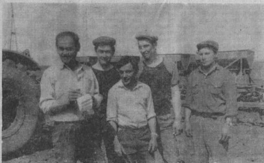
НА СНИМКЕ: засеяны последние гектары и на душе радостно.

Как звеньевой, так и членов его звена не покидает уверенность в благополучном исходе дела. Посевная кампания затянулась, но механизаторы не теряют надежды в выполнении договорных обязательств. Рано говорить об успехе звена, но очень хочется в это верить, ведь должна настойчивым сопутствовать удача.