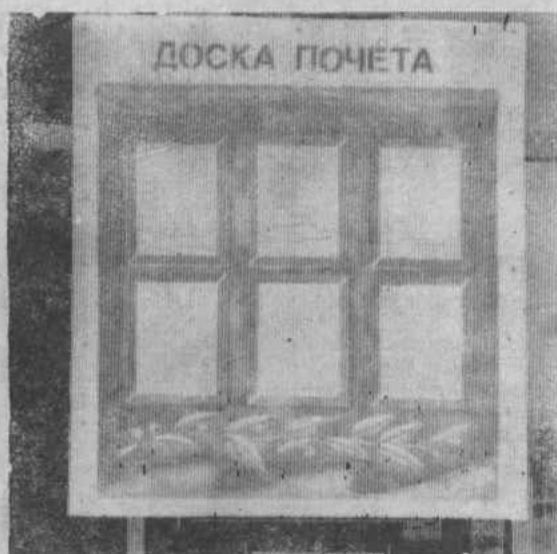
НА СНИМКЕ: Наглядный образец отношения к передовикам труда в райко.

СЕЛЬСКОЕ строительство — трудное строительство, такие слова можно слышать и в нашем тресте, и в его 292-й передвижной механизированной колонне. А в Хайбуллинском районе, расположенном в глубине, где нет леса, надлежачей материально-технической базы, где ощущается острая нехватка подготовленных кадров, успешно вести строительные работы еще труднее. Однако сегодня не те времена, чтоб сидеть сложа руки и сылаться на трудности. Надо обновлять села, дать второе дыхание краю, забытому в годы застоя, строить много и лучше.