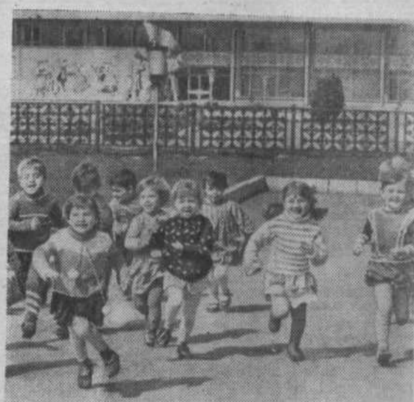
Ростовская область. Забота об устройстве малышей (на снимке).

может что-то изменится в этих вопросах. Для выхода из трудного положения по части игрушек, наш коллектив решил также провести 1 июня ярмарку. На средства, вырученные от продажи на ярмарке, купим детям своего ясли-сада игрушки. Призываем принять участие в подобных актах милосердия всех жителей района. У детей должно быть счастливое детство. Давайте сделаем шаг к этому. О. ПАВЛОВА, заведующая ясли-садом.