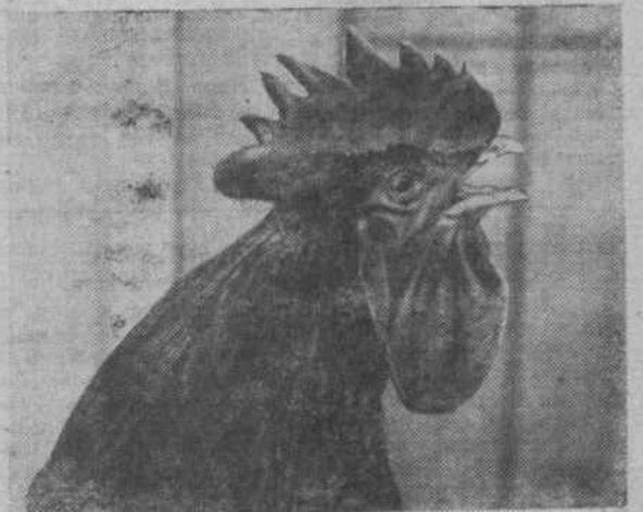
выставке то и дело были слышны громкие песни.