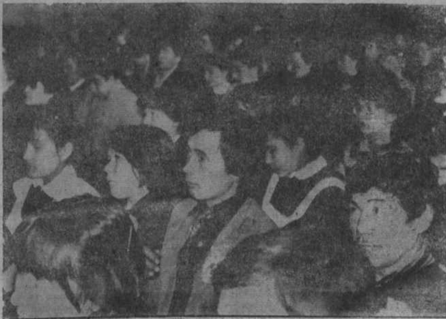
НА СНИМКЕ: в зале конференции.

Районный комитет комсомола проанализировав, обобщив предложения, составил план мероприятий по реализации критических замечаний и предложений, ход выполнения которого будет заслушан на ближайшем пленуме. Обсуждение отчета райкома ВЛКСМ побудил активность молодежи. Есть уверенность в том, что комсомольцы района не спящая темпоя, вабранных в период подготовки к районной комсомольской конференции, еще активнее включатся в социалистическое соревнование по достойной встрече XX съезда ВЛКСМ.