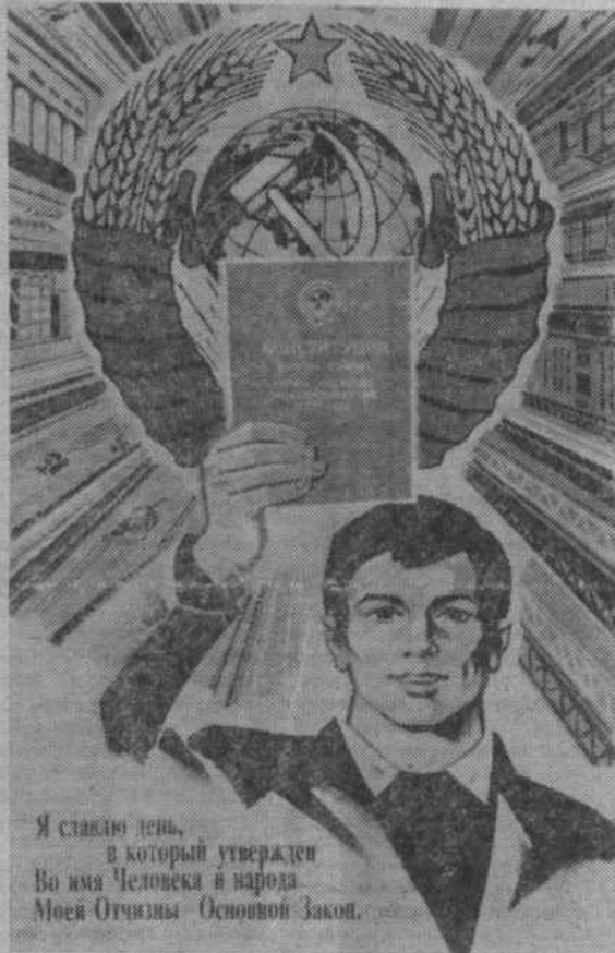
Плакат художника В. Сачкова. Издательство «Плакат».

Конституция СССР закрепляет также обязанности граждан, как оберегать интересы Советского государства, способствовать укреплению его могущества и богатства своим производительным трудом на благо общества.