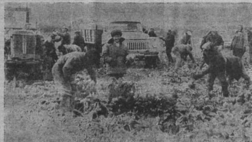
Неплохой урожай дает свекла в колхозе имени Фрунзе. Хорошая организация обработки, полива, своевременное внесение минеральных удобрений дали свои плоды. Ничего фрунзенцы получают ее более 300 центнеров с гектара. В уборке колхозникам большую помощь оказывают организации и учреждения райцентра.

Р. ИБРАГИМОВ, заместитель председателя районного комитета народного контроля.