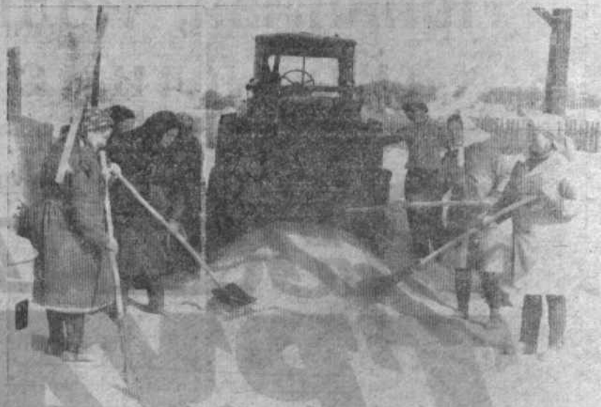
Четко организована работа на зерно току в колхозе имени Ленина. Работают по сменам, домохозяйки, учащиеся, обес печивают бесперебойную обработку зерна.

Партийные, профсоюзные, комсомольские комитеты и бюро обязали усилить контроль за качеством молока, широко применять меры морального и материального стимулирования работников ферм.