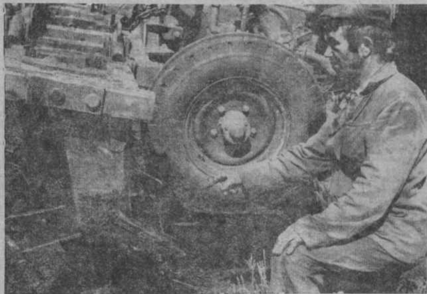
Адрес передового опыта: совхоз «Акъярский»