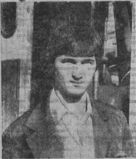
Труд водителя пассажирского транспорта не из легких. Выезжать из гаража приходится рано ут-

ром, возвращаться поздно вечером. И машину нужно содержать в исправном состоянии, что-