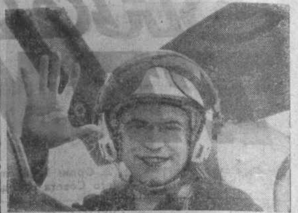
Хорошими успехами в боевой и политической подготовке встречают свой праздник воины Н-ской отдельной авиационной части Краснознаменного Прикарпатского военного округа.

«Решения XXVII съезда КПСС выполним, надежно защитим завоевания социализма!» — под таким девизом здесь все шире разворачивается социалистическое соревнование. Военные летчики, стремясь быть достойными своих отцов и дедов-фронтовиков, на каждодневных занятиях в классах, на тренажерах и аэродроме постоянно совершенствуют свое боевое мастерство.