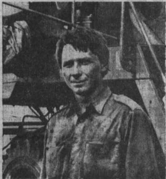
днем выработка увеличивается.

Здесь на новоукраинских полях работают и прибывшие на помощь комбайнеры из Мечетлинского района. Пока им непривычно в новых условиях, но с каждым