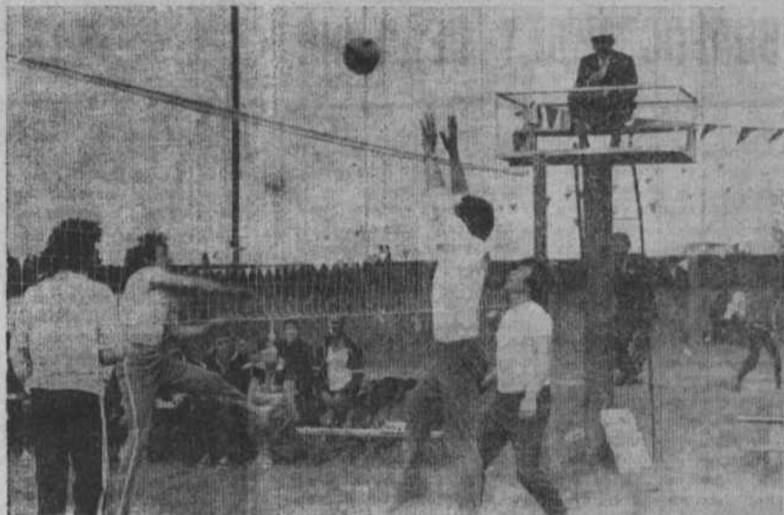
Идут жаркие схватки волейболистов на стадионе «Урожай» с. Анжар.

В 1985 году на туристических маршрутах и базах провели свой отпуск 38 млн. человек.