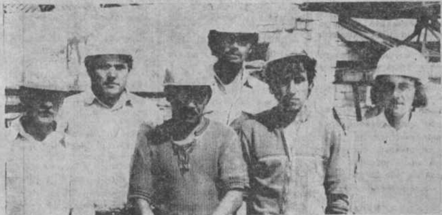
НА СНИМКАХ: бригадир каменщиков-монтаж-