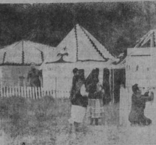
Старинные башкирские юрты.