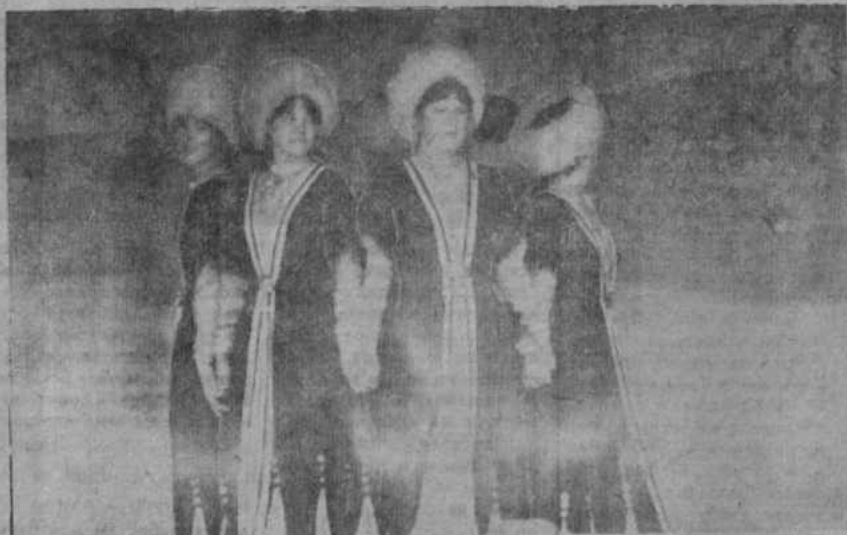
Танцевальный коллектив Целинного Дома культуры исполняет девичий лирический танец.