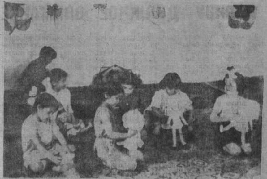
НА СНИМКЕ: Воспитанники детского сада № 1, с. Акъяр.