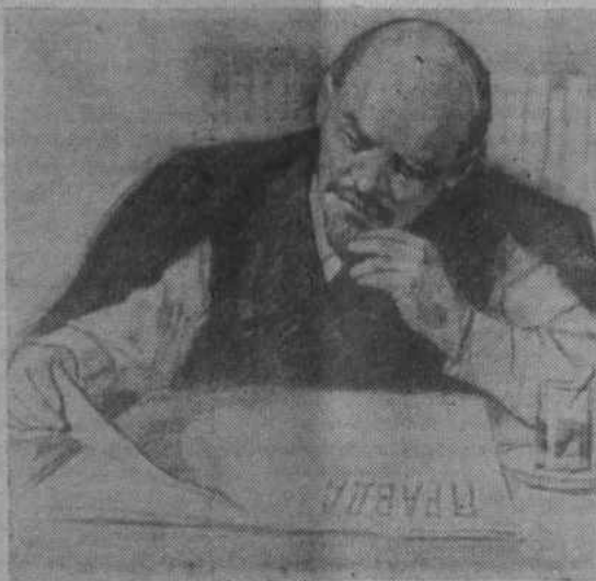
В. И. Ленин за чтением газеты «Правда».