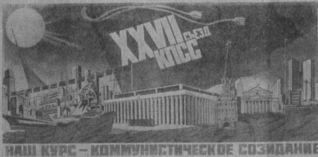
Плакат художника В. Викторова.