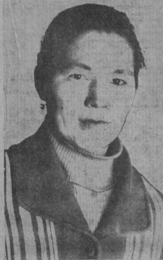
о достойной встрече XXVII съезда нашей партии.