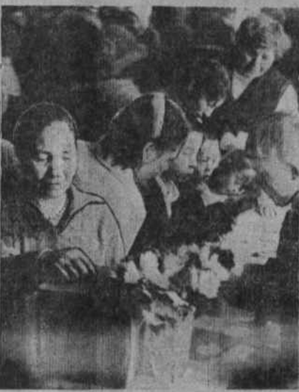
НА СНИМКЕ: участники ярмарки мира.