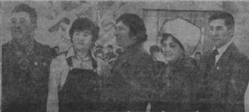
НА СНИМКЕ: группа делегатов из парторганизации Хайбуллинского совхоза.

ванной поднять всю учебно-воспитательную работу на качественно новый