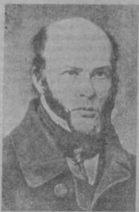
Имя Николая Ивановича Пирогова (1810—1881), великого русского хирурга, анатома и патолога, ос-

новоположника военной полевой хирургии, организации и тактики медицинского обеспечения войск, выдающегося общественного деятеля и педагога, известно во всем мире.