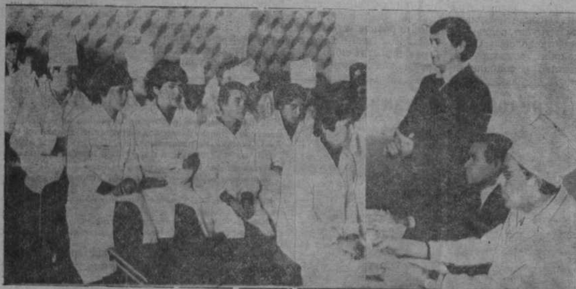
Работники районной больницы приступили к изучению предложенного курса в школе научного