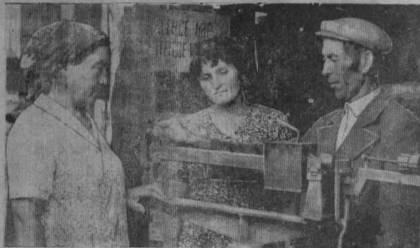
РЕЙД НАРОДНОГО КОНТРОЛЯ И ГАЗЕТЫ «ЗНАМЯ ТРУДА»

Как это ни странно, но в осенний период мы не видим изобилия овощей и фруктов в наших магазинах. А если они появляются на прилавках, то качество их довольно низкое. За капустой, луком, огурцами и помидорами моментально выстраивается очередь, приобрести их все желающие не могут: завозится эта продукция в малом количестве.