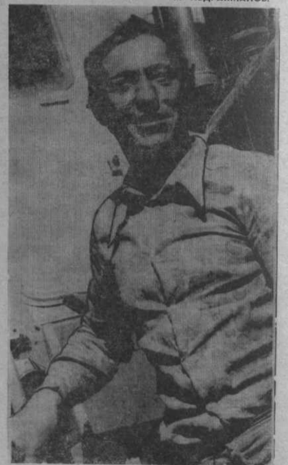
НА СНИМКАХ: Н. А.