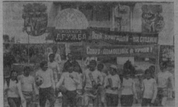
НА ВЕРХНЕМ СНИМКЕ: в колхозе «Дружба» Лазовского района Молдавской ССР популярна новая физкультурная традиция — «Всей бригадой — на стадион!».

Искусство быть здоровым требует от каждого немалых усилий. Перед советскими спортивными организациями стоит грандиозная задача превращения массового физкультурного движения в общенародное.