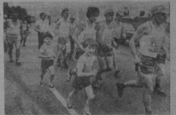
НА НИЖНЕМ СНИМКЕ: около двадцати дней занял 825-километровый пробег вокруг Ладожского озера. Его провели в дни отпуска любители бега Ленинградской области.