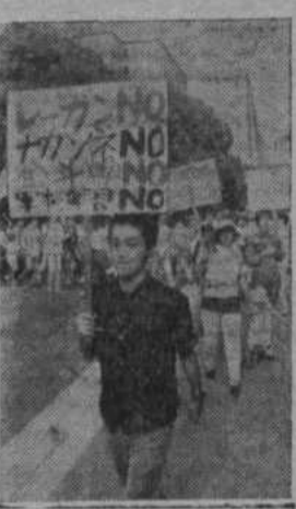
Редактор Ф. Д. МУХАМЕТОВ.