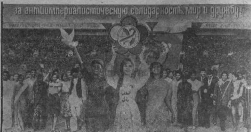
Плакат «За антиимпериалистическую солидарность, мир и дружбу!». Издательство «Плакат».

Великий подвиг народа — источник вдохновения. Материалы объединенного пленума правления творческих союзов и организаций СССР. Апрель 1985 года.