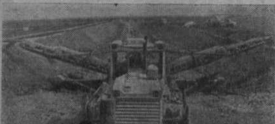
Оренбургская область. Активно ведется мелноразливное обустройство угодий совхоза «Самородовский». НА СНИМКЕ: экскаватор ведет прокладку оросительного канала, длина которого составит 2760 метров.

Правда, не все колхозы и совхозы имеют пока хорошую материально-техническую базу, квалифицированных мастеров-наладчиков, и им самим просто не под силу содержать в постоянной готовности машины и механизмы. Поэтому животноводы таких хозяйств нуж-