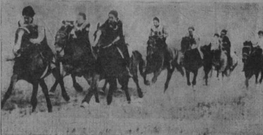
Конная скачка на 4 километра.