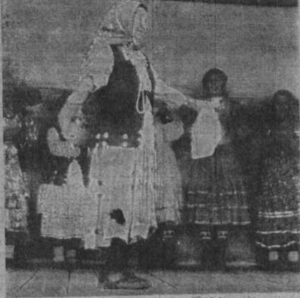
Выступает фольклорная группа из колхоза имени Калинина.