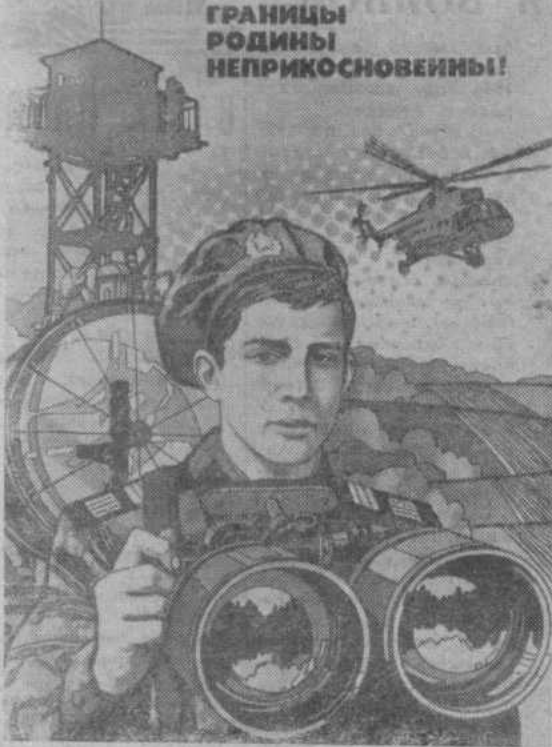
Плакат «Границы Родины неприкосновенны». Художник В. Фекляев.