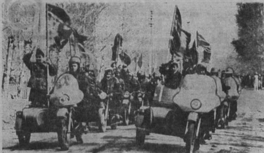
Торжественное шествие праздничной колонны мотоциклистов и конников.