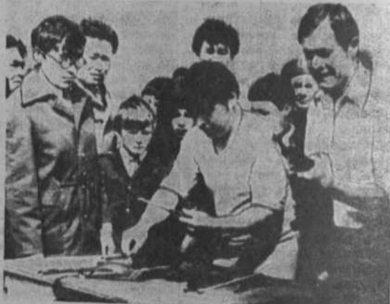
Разборка и сборка автомата.