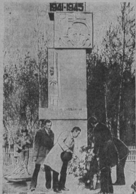
Возложение венков к памятнику хайбуллинцам, павшим в Великой Отечественной войне.

Репортаж подготовили: В. АБДРАХМАНОВ, Р. ИМАНГУЛОВ, В. УСМАНОВ.