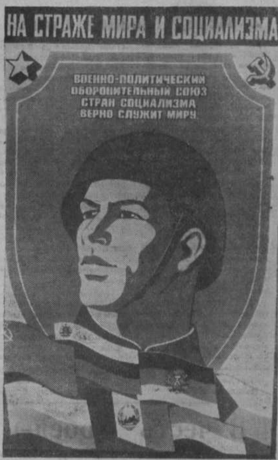
Плакат художника М. ГЕТМАНА. Издательство «Плакат».

Благодаря твердой позиции и активному противодействию государств — участников Варшавского Договора были сорваны многие агрессивные планы империалистических держав в отношении социалистических стран, народов, борющихся за свою национальную независимость. Во все годы существования Варшавский Договор выступает как активный фактор мира, мощный инструмент безопасности в Европе и во