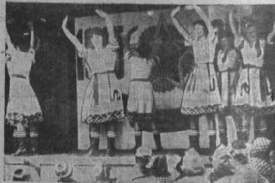
Выступление участников художественной самодеятельности.