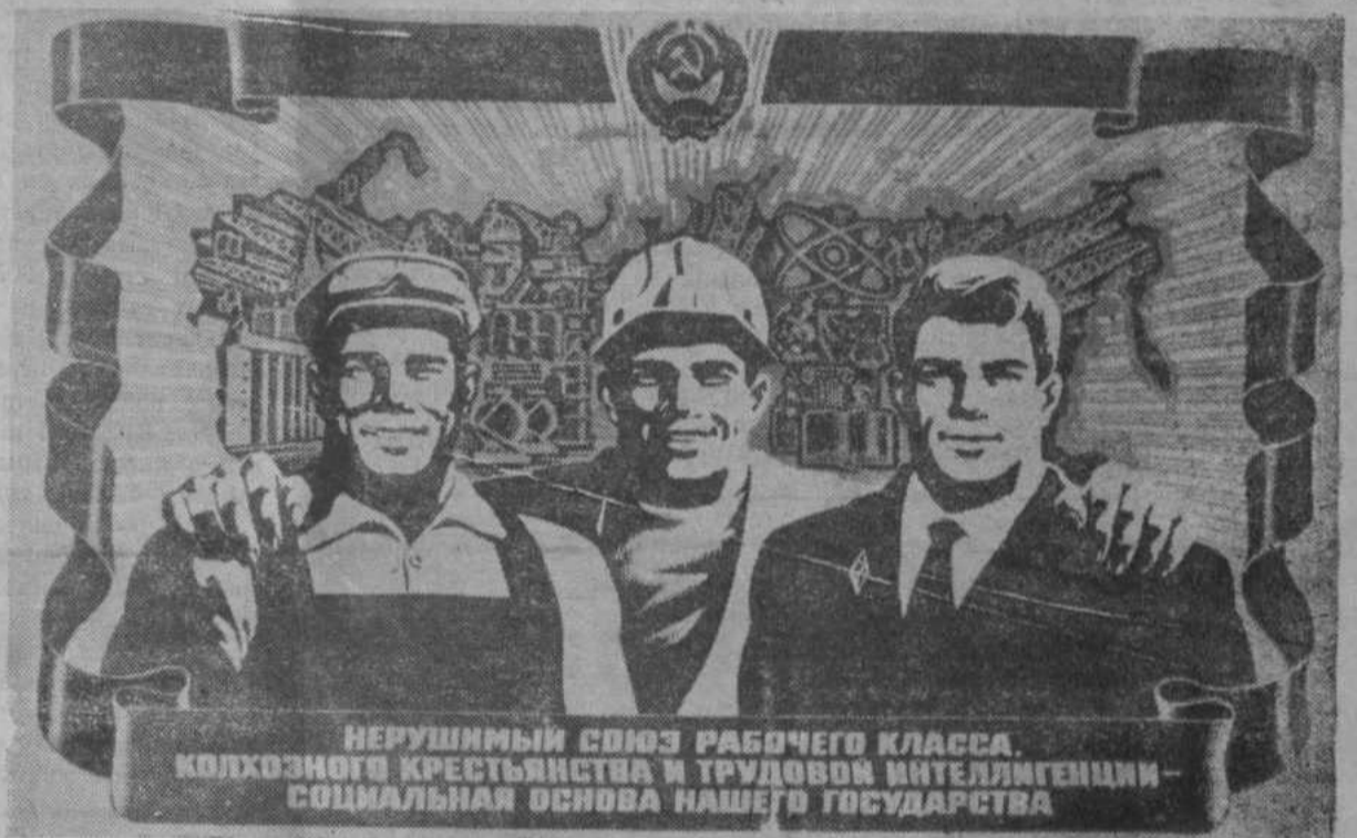
Плакат художника С. Жмуренкова.

Идеи и положения Конституции СССР материализуются в повседневной деятельности миллионов. По всей стране широко развернулось социалистическое соревнование под девизом: «40-летию Победы советского народа в Великой Отечественной войне—40 ударных трудовых недель!». В единый могучий поток созидания вливаются трудовые усилия трудящихся нашего района. Коллективы промышленных предприятий района успешно справились с девятимесячными заданиями по реализации основных видов товарной продукции. Животноводы района выполнили задания 9-и месяцев заготовок мяса, молока и полины решимости внести весомый вклад в реализацию Продовольственной программы.