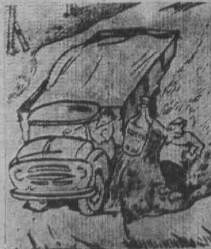
—Махнем «Пшеничную» на пшеницу? Рис. Ю. ГРИГОРЬЕВА.

Коза гостей однажды пригласила: Знакомых и родных, соседей не забыла, Чтоб сдвинуть ее: «Коза щедрая!» Стоя у Козы, ломился от добра. Явилось жадных множество пород. Хозяйка званных просит в огород: —Добро пожаловать! Для вас я стол накрыла! Гостеприимством всех пленила! И гости принялись усердно за еду, С грибами перебежая на гриду, Хозяйке и еде оказывали честь, И съели все они, что можно было съесть. А щедрая Коза все просят об одном: —Покушайте еще! Не брезгуйте добром! Неужто так щедра Коза? Нет, крепко спали сторожа!