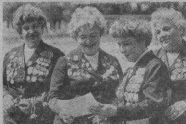
Отчизны, говорят их награды. Участницы клуба часто выступают перед молодыми рабочими, зем-

ледельцами, призывниками, школьниками и студентами. (Фотохроника ТАСС).