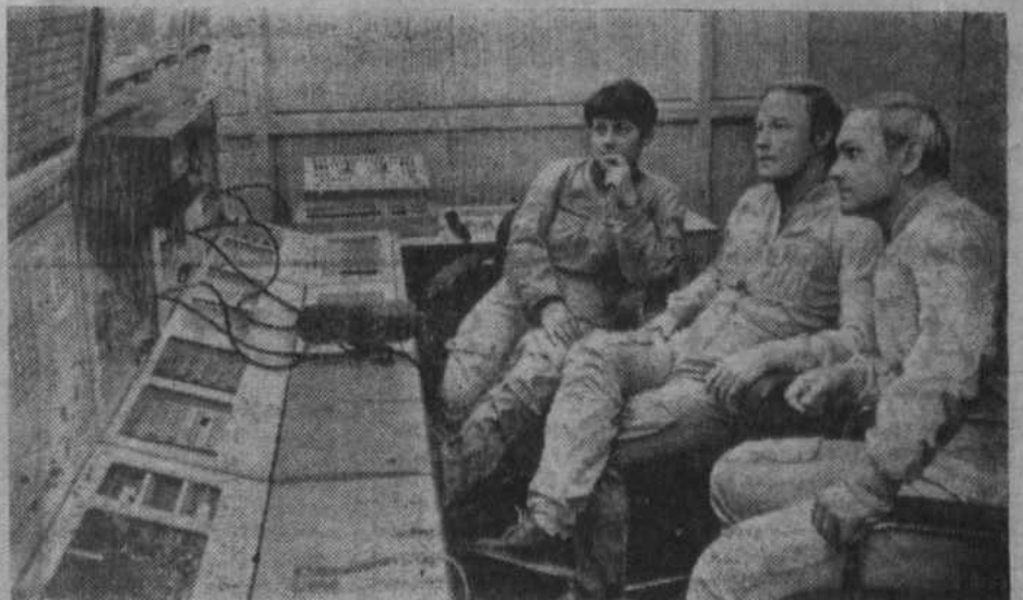
Справа налево — командир экипажа летчик-космонавт СССР дважды Герой Советского Союза Владимир Александрович