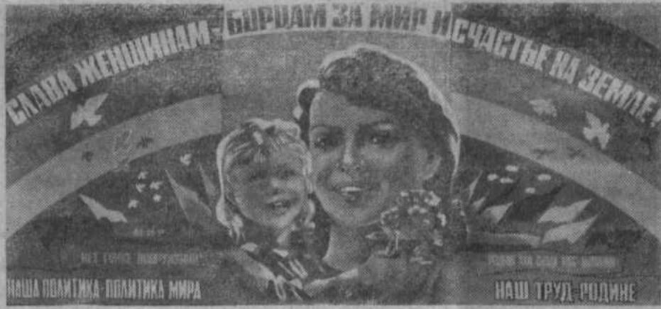
Плакат художников Л. Бельского и В. Потапова.