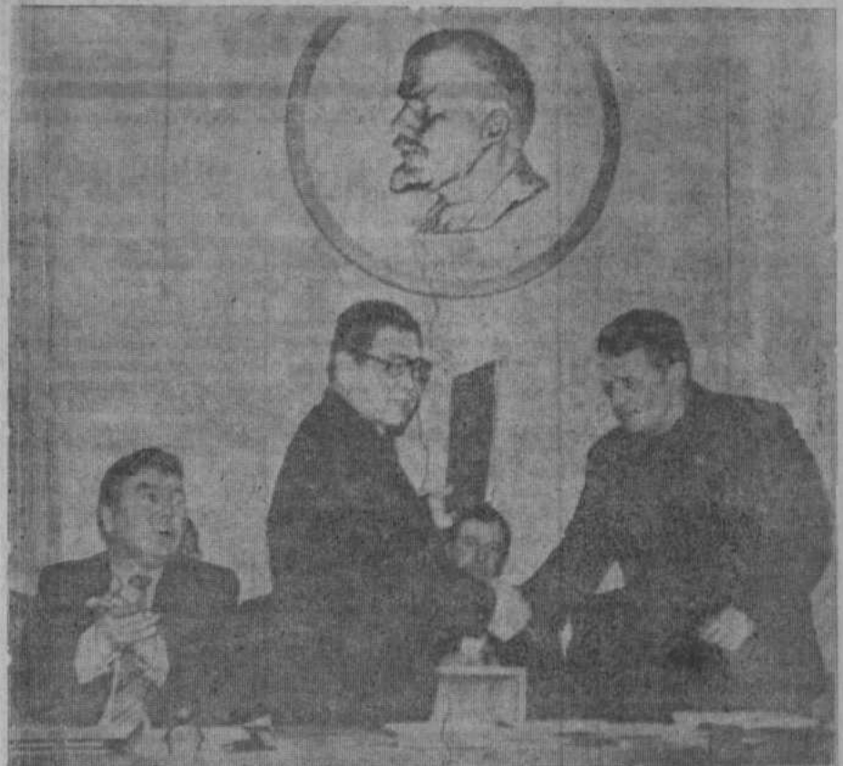
Вручение договора на социалистическое соревнование в 1984 году руководителю делегации Гайского района Оренбургской области.

Следует отметить, что внедрение безарядной системы в полеводстве