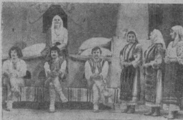
Пятьдесят лет исполнилось Молдавскому государственному академическому ордену Трудового Красного знамени музыкально-драматическому театру имени А. С. Пушкина.

Кроме современных спектаклей на сцене театра ставятся произведения классической драматургии, драматургии братских народов.