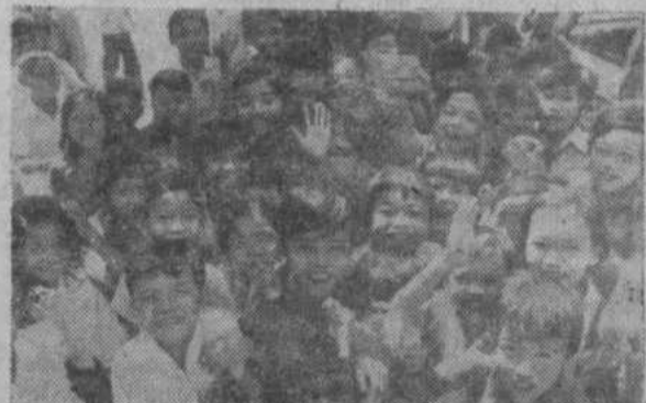
НРК. Большую заботу о юных гражданах республики проявляет Народно-революционная партия Кампучии. В стране уже открыто более 600 дошкольных учреждений, которые посещают около 20 тысяч малышей. Государство обеспечивает ребят бесплатным питанием, под детские сады отведены лучшие помещения, открыты курсы по подготовке воспитателей. Большую роль в этом деле Кампучии оказывают братские социалистические страны.