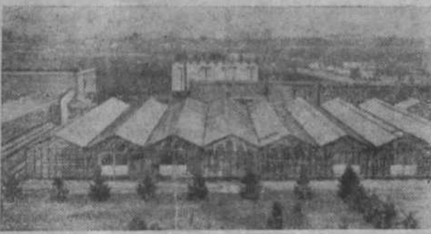
Краснодарский край. Перед селекционерами ордена Ленина и ордена Трудового Красного Знамени Всесоюзного науч-

но-исследовательского института масличных культур, который носит имя В. С. Пустовойта, стоят большие задачи: получить с